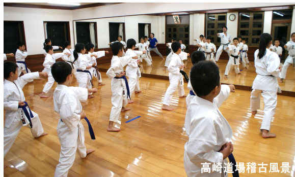
高崎道場稽古風景