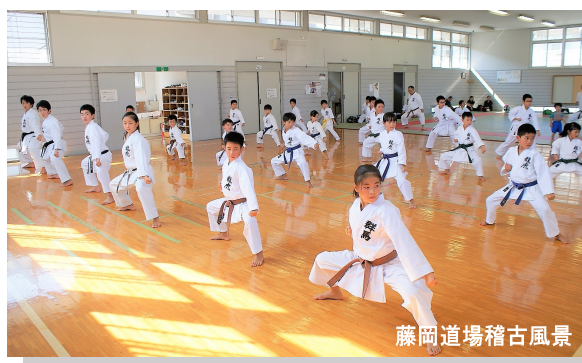
藤岡道場稽古風景

龍虎会各道場では幼児から大人まで一緒に楽しく汗を流しております。見学・体験は各道場、随時受付中！