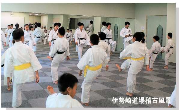
伊勢崎道場稽古風景